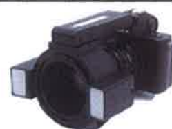
クリアファイバーPro6