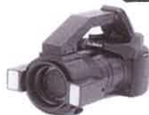
クリアファイバーⅣ