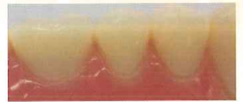
10分間超音波処理後